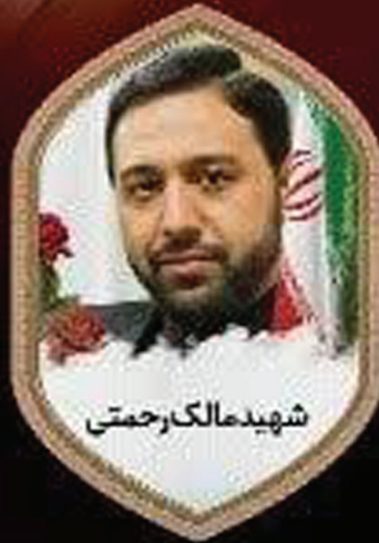
شهید مالک رحمتی